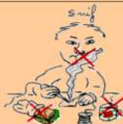
Étourdissements par inhalation des vapeurs.

Ranger le fer dans son support après chaque utilisation.