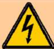
Le câble électrique fond, entraînant des risques d'électrisation et de courts-circuits.

Mettre des lunettes de protection si nécessaire.