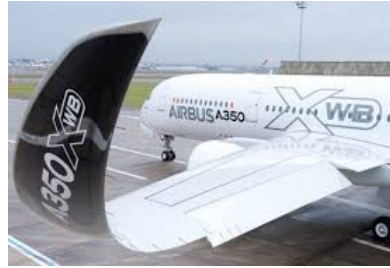
de nouvelles ailes d'avion