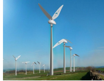
de nouvelles éoliennes