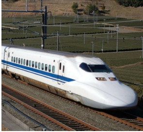
Un nouveau train bain

L'Homme crée des objets techniques très variés, mais y a-t-il des points communs entre ces différents objets ? Quel est le lien entre les objets techniques suivants ?